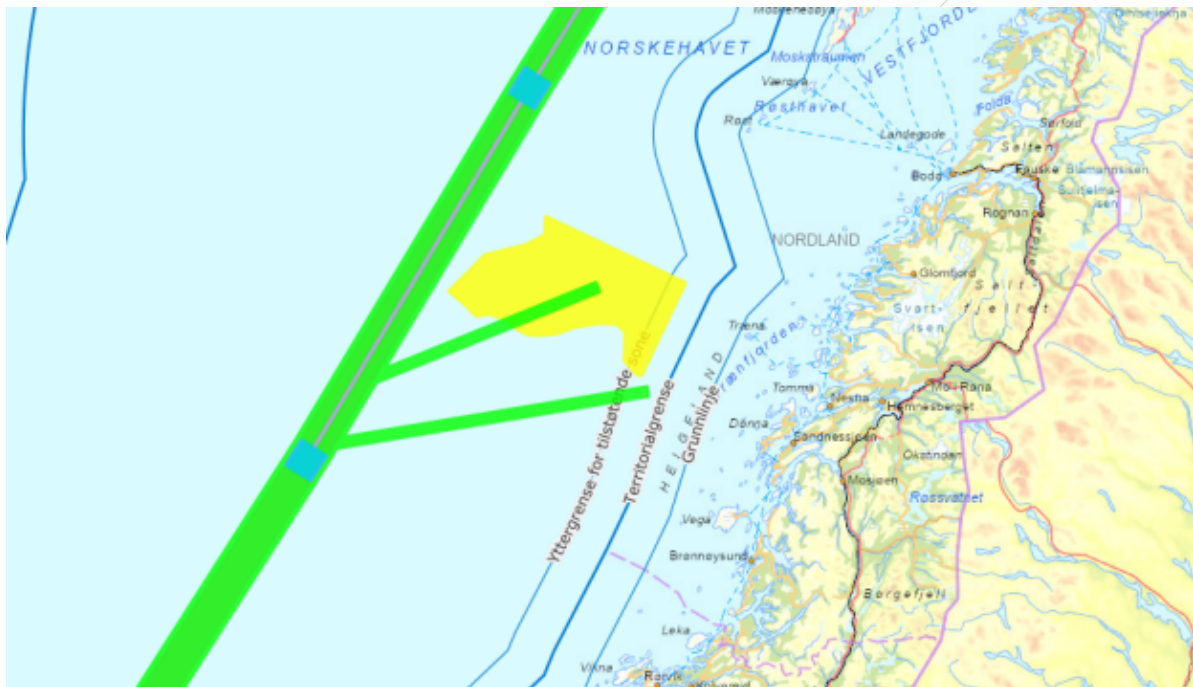
Fig.3: Foreløpige ruter/skipskorridorer og overlapp med havbruksområde

Kystverket stiller seg til disposisjon for Fiskeridirektoratet til å diskutere våre innspill nærmere